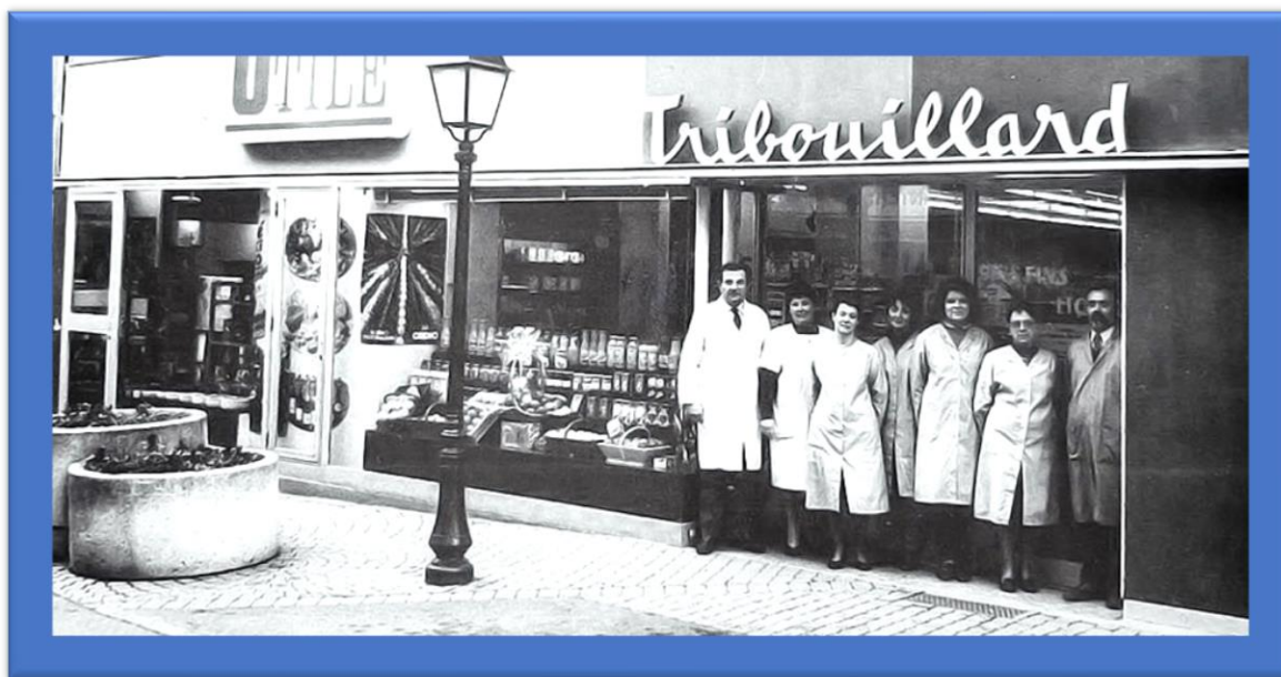
Bressuire raconte ses commerces d'antan (1900-1950), 2017, p.45.

La maison Tribouillard est désormais la dernière épicerie de ce type dans la rue commerçante après la disparition du Novalia-Monoprix (ex-Nouvelles Galeries). Elle doit désormais se battre contre l'implantation des supermarchés : le SUMA La Source, installé