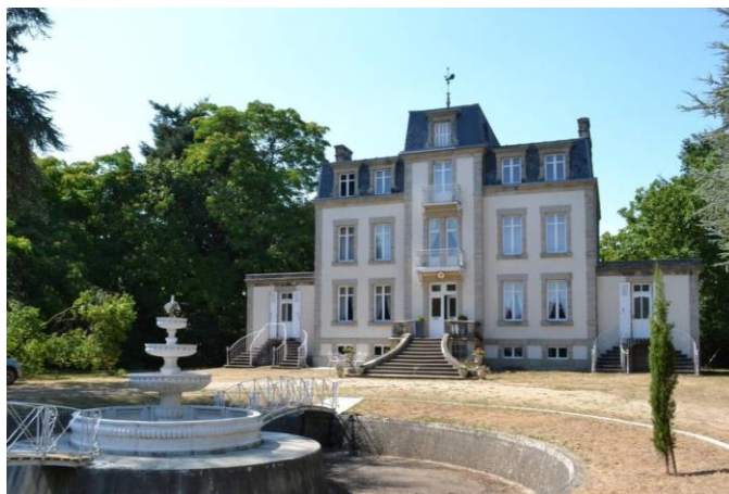
La Petite-Gâtière aujourd'hui

affirmaient des valeurs antirépublicaines, très conservatrices et catholiques, le nom du cheval paraît comme une provocation.