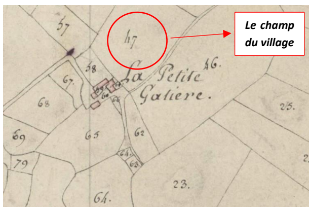
Extrait du cadastre de Breuil-Chaussée de 1811