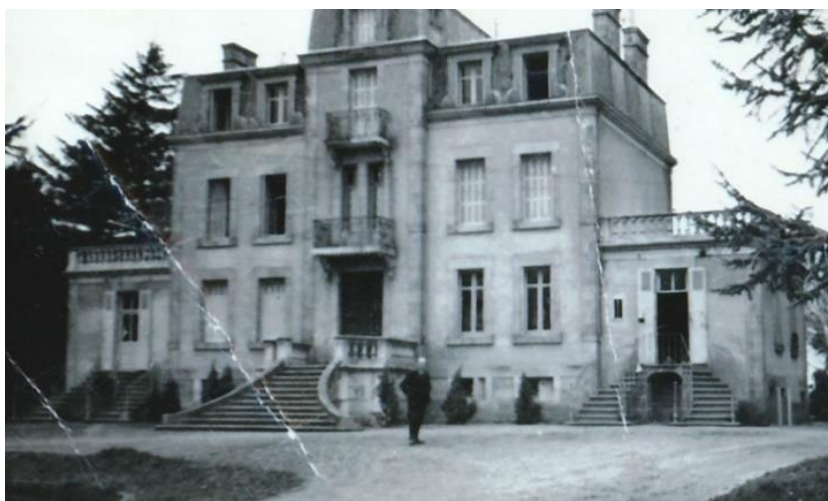
La petite-Gatière en 1948 avec Marcel Bage-Cesbron

Elle se développe sur 3 niveaux dont la partie centrale en avancée, s'élève un peu plus haut, avec deux ailes de chaque côté. Le dernier niveau est mansardé avec un toit couvert en ardoise. Une cave sous tout le bâtiment, semi-enterrée, lui assure une bonne ventilation.