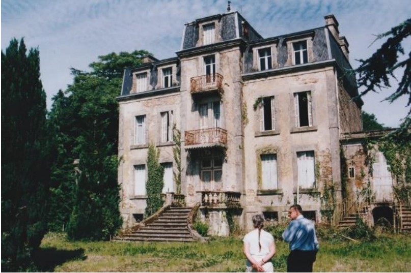
La Petite Gâtère avant sa restauration entreprise par M. et Mme Smid.

travaux auraient été nécessaires pour remettre le château en parfait état mais ils n'ont pas eu lieu. Le château s'est dégradé pendant une dizaine d'années, menaçant ruine.